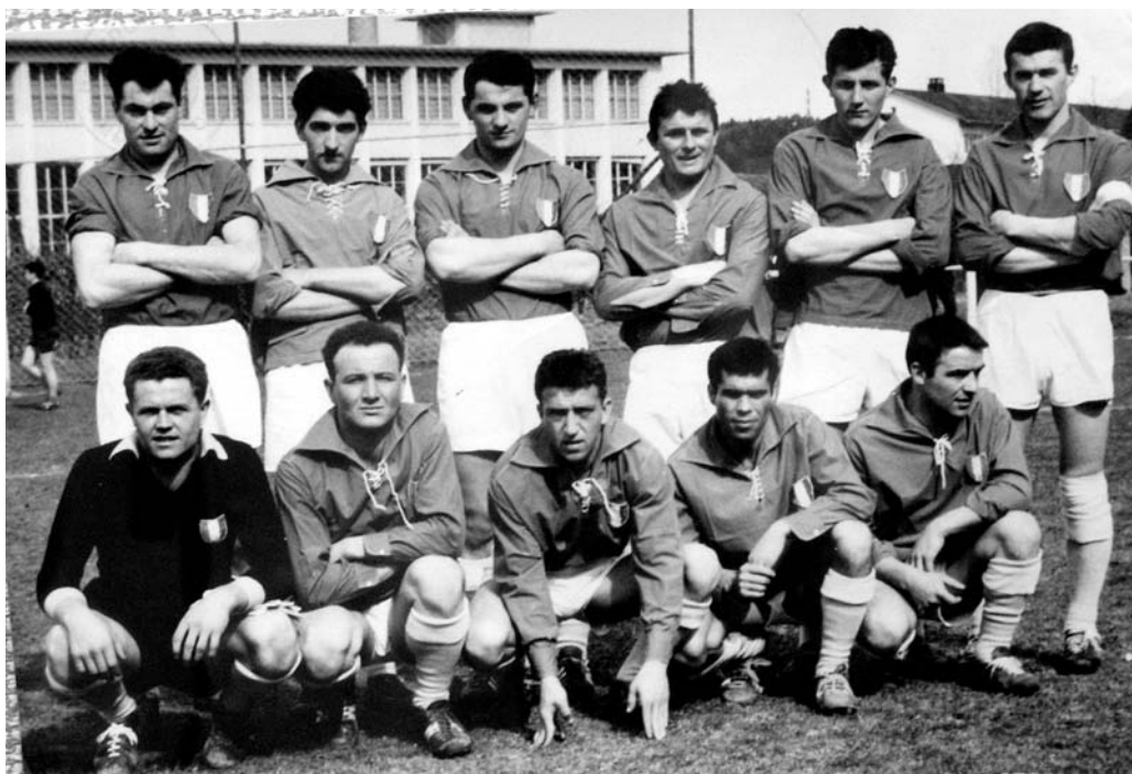
La prima squadra di calcio della CLI di Uster.

● Nella nostra sede gestivamo un collettivo della cassa malati «Union» che poi nel tempo ha cambiato nome aderendo ad altre assicurazioni malattia. Fu un impegno non indifferente per i responsabili. Allora non c'erano i computer e tutto il lavoro, registrazione dei versamenti, pagamento e registrazione fatture mediche, reclami ecc. veniva svolto manualmente, per oltre 500 iscritti. La cassa malati era una attività importante. Essendo un collettivo le tariffe per i soci erano inferiori, potevamo dare una consulenza in lingua italiana e