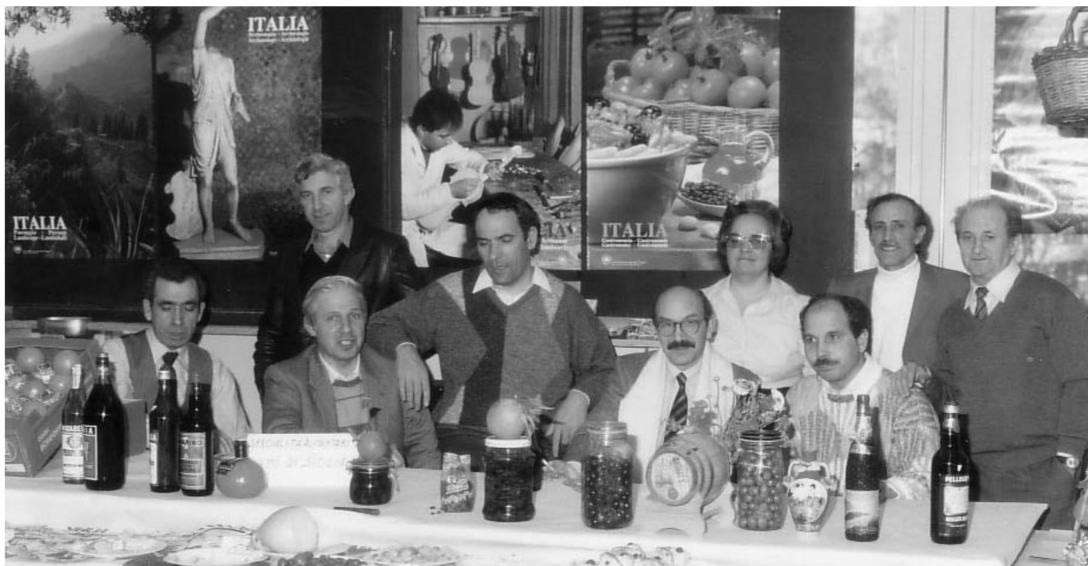
Ein grosser Erfolg unter den Aktivitäten der CLI Uster war eine Ausstellung über die vielfältigen sizislinischen Produkte.

teilte sich inskünftig an der Organisation des 1. Mai und organisierte gemeinsam mit der SP verschiedene Informationsabende zu vielfältigsten Themen, welche von der Drogenproblematik über das Miet- und Familienrecht der Schweiz bis hin zum Umweltthemen reichten. Durch den Niedergang wichtiger Industriezweige in der Region nahm aber auch der Bedarf an Beratungsleistungen zu: Die CLI kämpfte gemeinsam mit den Gewerkschaften dafür – bzw. brachte diese dazu –, dass die entlassenen Arbeiter von Heusser-Staub, Volmoeller und Polster Möbel mit einem Sozialplan unterstützt wurden. Auch half sie neu beim Ausfüllen von Steuererklärungen. In die 80er Jahre fällt auch der Beginn des Kampfes für eine Mitsprache von Ausländerinnen und Ausländer auf Gemeindeebene. Die CLI leistete grosse Arbeit mit der Organisation der Zusammenkunft aller ausländischen Vereine in Uster. Sie überzeugten sie von der Notwendigkeit einer Petition und ersuchten sie, Unterschriften zu sammeln. Die neu gegründete Arbeitsgruppe informierte die Schweizer Parteien über diese Petition, organisierte die Propaganda und eine Pressekonferenz, um die Petition zu veröffentlichen und das Ergebnis der Unterschriftensammlung bekannt zu geben. Die SP Uster unterstützte die CLI stark in ihrem Anliegen. Die Presse räumte der Petition viel Platz in den lokalen und kantonalen Zeitungen ein. Der Ustermer Gemeinderat lehnte die Initiative aber schliesslich leider ab.