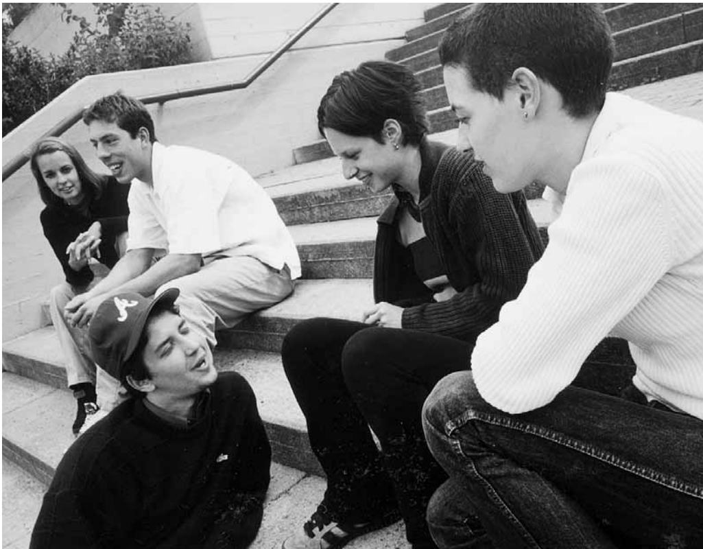
Schwierig haben es die Jugendlichen, die eine Lehrstelle suchen. Viele von ihnen sind mit der bitteren Erfahrung konfrontiert, dass es für sie in der Arbeitswelt keinen Platz gibt – oder einen, den sie sich nicht unbedingt wünschen.

etwas leichter.» Gefordert sind hier, wieder einmal, die Lehrerinnen und Lehrer.