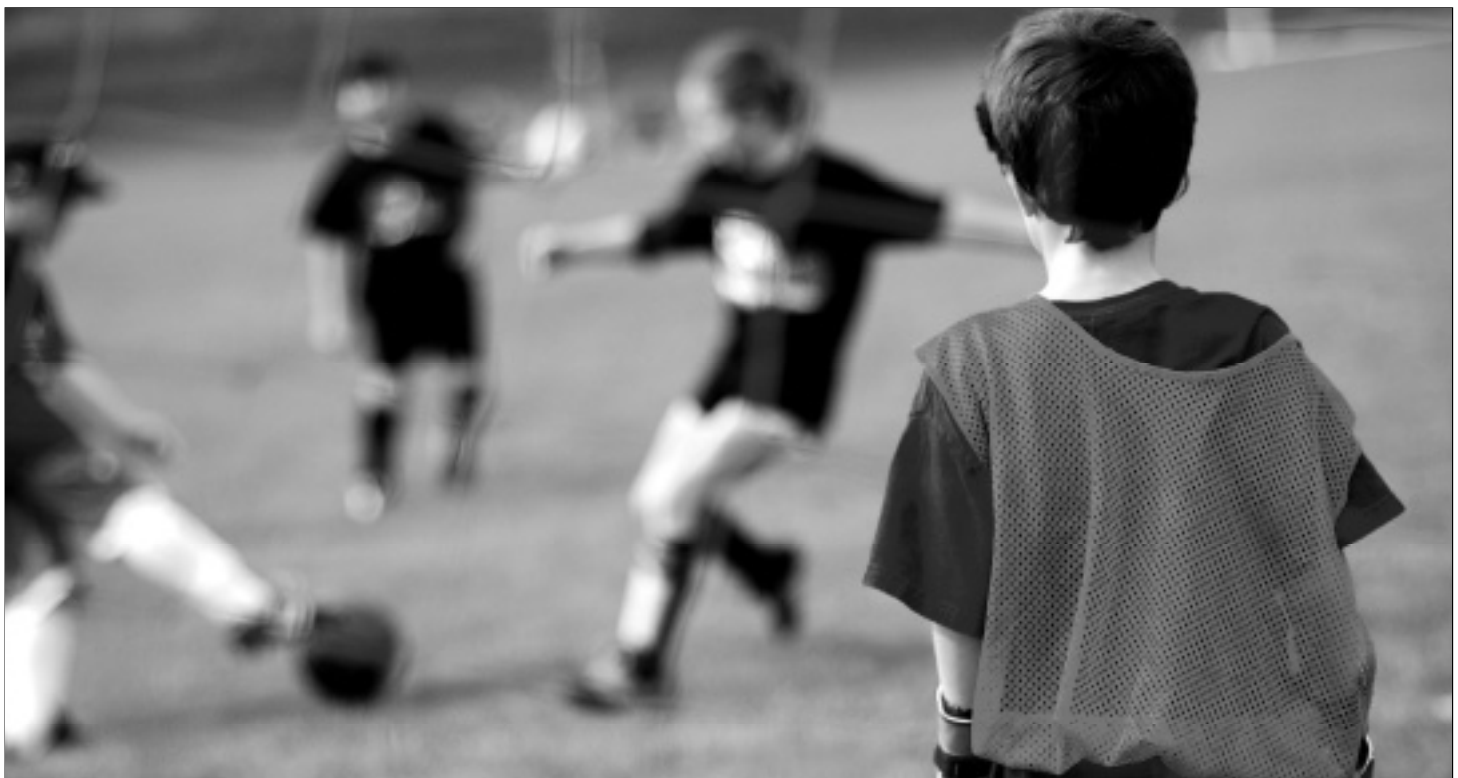
Die verschiedensten Vereine werden profitieren von dieser Initiative: keine unnötigen Gebühren, keine unnötige Bürokratie.

Die Initiative will eine dauerhaft gesicherte und unbürokratische Unterstützung der Vereine. Ein grosser Papierkrieg ist dazu nicht nötig. Die Stadt Uster hat als Vermieterin ja stets den Überblick,