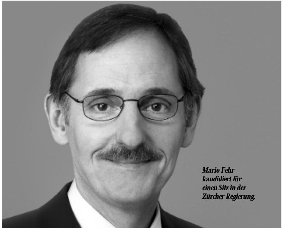
Mario Fehr kandidiert für einen Sitz in der Zürcher Regierung.

8 Jahre Gemeinderat in Adliswil, 16 Jahre Stadtrat in Adliswil, 9 Jahre Kantonsrat, 5 Jahre Verfassungsrat, 12 Jahre Nationalrat: Es gibt kaum ein Thema, eine Debatte, an der Mario Fehr nicht in der einen oder anderen Art beteiligt war. Er hat ein feines Gespür für Diskussionen, ist ein ebenso begnadeter wie witziger Debattierer und versteht es durchaus, die Medien für sich einzunehmen. Ein idealer Politiker fürs Medienzeitalter, schrieb die NZZ ihrem Porträt, und liess mit