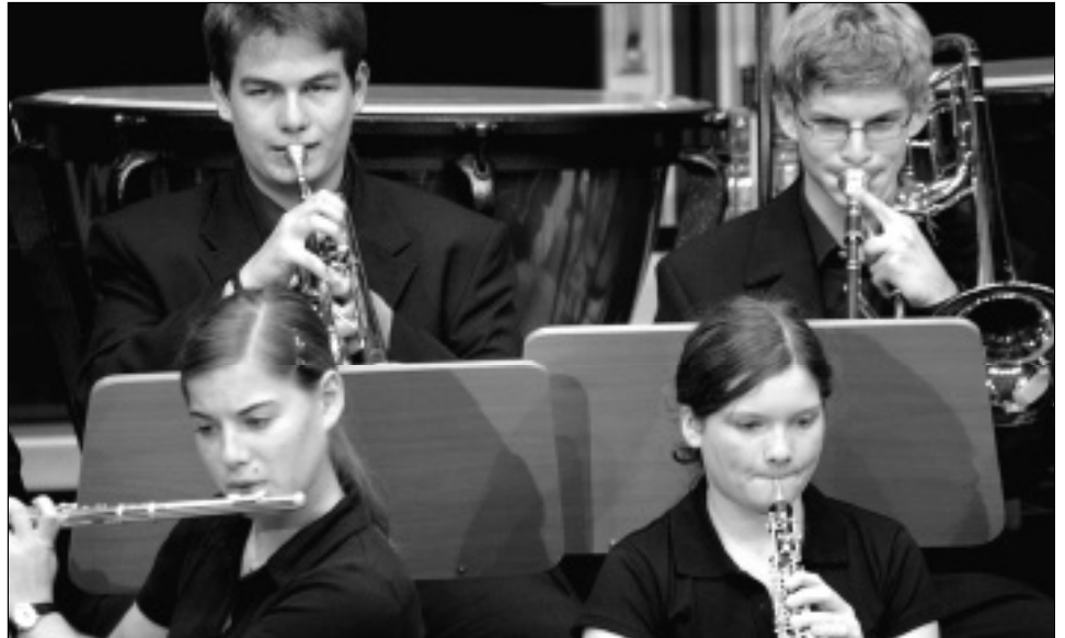
Ob Kultur oder Sport: Die Jugendarbeit der Vereine muss gefördert und belohnt werden.

Für das Initiativkomitee ist klar, dass zu einer umfassenden Jugendförderung auch das kostenlose zur Verfügung stellen von genügend Räumlichkeiten gehört. Mit der Initiative soll erreicht werden, dass Vereine ihre finanziellen Mittel direkt in die Jugend investieren können. Und nicht, dass sie das Geld der Eltern und Sponsoren wieder der Stadt abliefern müssen. Mit einem JA zur Volksinitiative «Keine Gebühren zulasten von Jugend- und Sportvereinen» wird dies möglich.