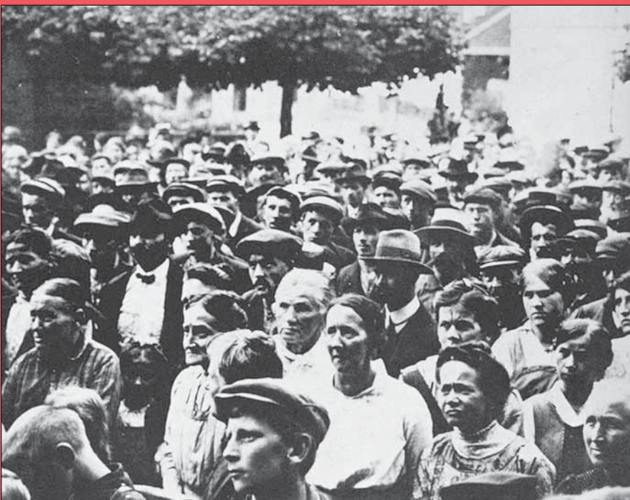
Das politische Gewicht der SP war im industrialisierten Uster von Beginn an beträchtlich: Arbeiterkundgebung zur Zeit des 1. Weltkrieges.

Politik allein ist es nicht, was die Genossinnen und Genossen zusammenhält. Etwas Spass ist erlaubt: «Gen. Koch macht die Anregung, diesen Sommer das Kraftwerk Eglisau zu besuchen. Einhellige Zustimmung. Betreffend Bahn, oder Autofahrt erklärt sich die Mehrheit für letzteres.» Noch muss es nicht der öffentliche Verkehr sein (1926). Auch für die Frauengruppe stellt in den 1950er-Jahren der