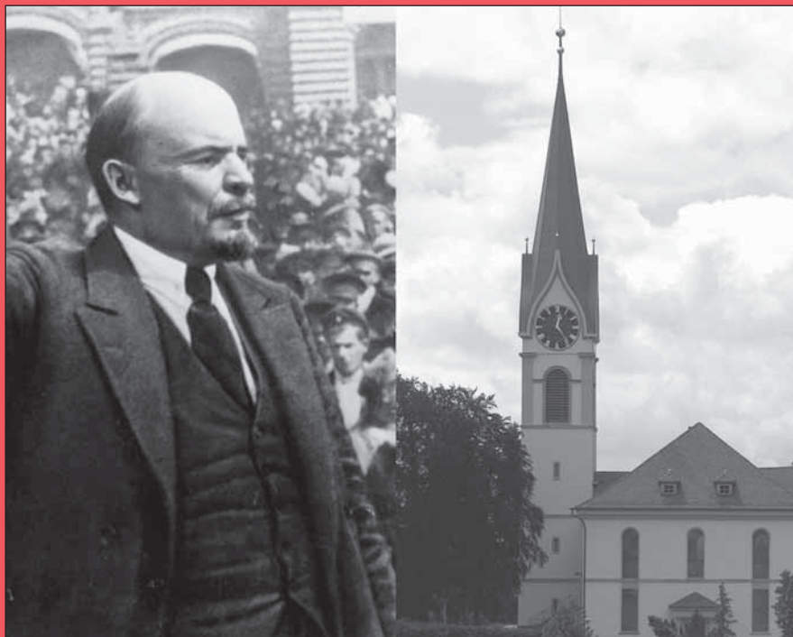
Internationale Revolution oder sich lokalen Themen widmen: Was im Fokus der SP Uster stehen soll, darüber wurde in den Gründungsjahren heftig gestritten.

Bei der Gründung werden weitere wichtige Entscheide gefasst: Das «Volksrecht» wird zum Publikationsorgan bestimmt, später für die Mitglieder obligatorisch erklärt, ohne hundertprozentigen Erfolg. Der Monatsbeitrag wird auf 60 Cents fest-