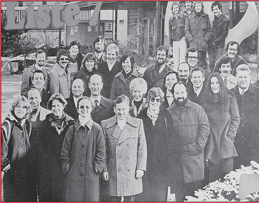
Alte und neue Linke bei den Gemeindewahlen 1978 noch vereint: Ein Jahr später kam es zur Abspaltung des alten gewerkschaftlichen Flügels.

«Bummel» im Sommer den Höhepunkt des Veranstaltungsjahres dar, selbst wenn er nur bis Freudwil oder Greifensee führt. Selbst die 68er-Generation entwickelt eine Festkultur, von der Maifeier über das Forumfest bis zum grandiosen Maskenball.