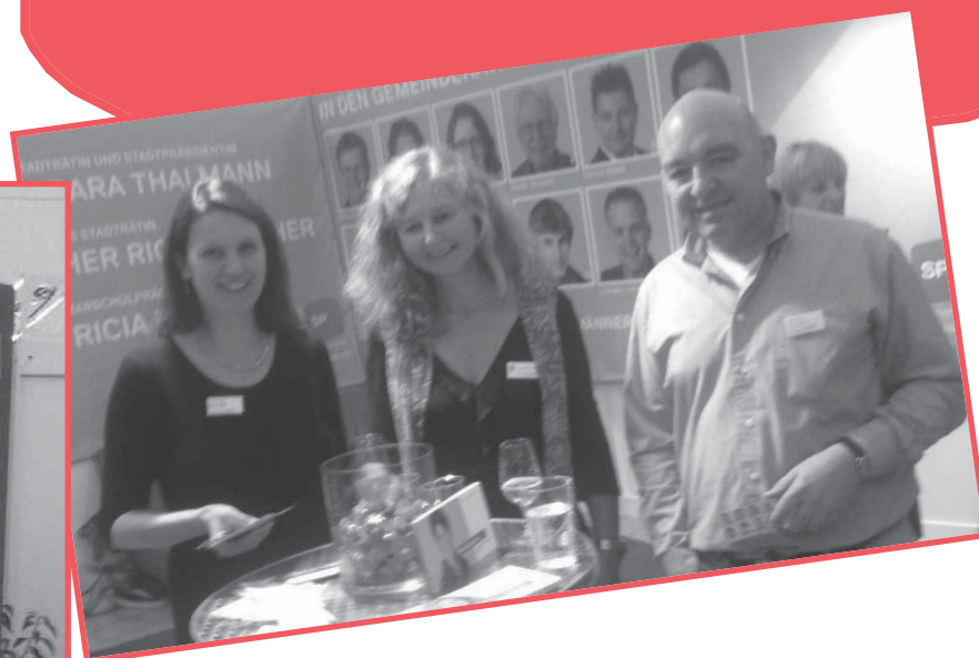
Impressionen vom Stand der SP Uster an der Uster Messe 2013.